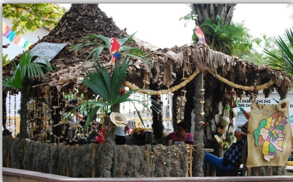
Celebración de festival de la tusa

La población del municipio es de origen lenca se deduce por las características físicas de los pobladores de algunas comunidades también existen montículos de origen lenca. En el municipio existe un grupo autóctono llamado CARAMBEROS DE NUEVO CELILAC, reconocidos a nivel nacional e internacional por su música y por el uso de instrumentos tradicionales. El único idioma hablado en la población del municipio es el español como en la mayoría del país. Una de las principales formas de recreación de la población es el fútbol que es un llamativo para la mayoría de las personas, otra de la recreación aunque en ocasiones es la carrera de jinetes a caballo por cinta que se realiza para recaudar fondos.